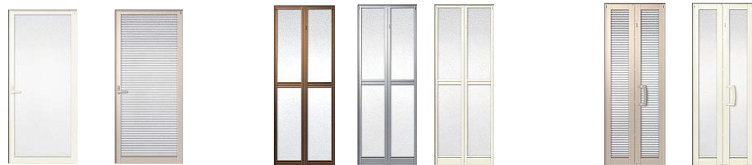
左:樹脂パネルドア

浴槽への転落・溺れ事故防止には浴槽の残り湯を抜く・湯を張っている間は滑りにくい頑丈な風呂蓋をする・浴室の幼児の届かない場所に外鍵を付ける方法があります。ドアのやり替えには下のような脱衣室側のお子様の手の届きにくい高さにオプションでチャイルドロックを取り付けられる浴室ドアもあります(写真はトステム製)