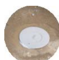
←セントリコンステーション設置状況