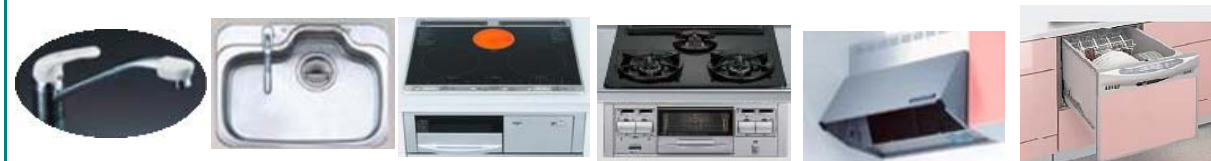
水栓 シンク IHクッキングヒーター ガスコンロ シロッコファン 食洗機