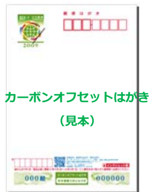
カーボンオフセットはがき(見本)

※カモメールには、無地・柄物等いろいろな種類がありますが、左の画像は、カーボンオフセットはがき(地球温暖化防止寄付金付き)のカモメールデザインの一列です