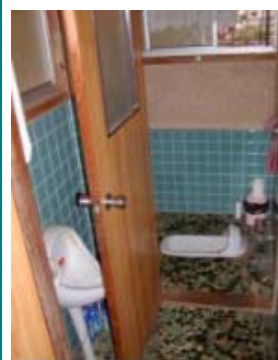
汲取りから水洗洋式へ 使い勝手良いトイレへ変身