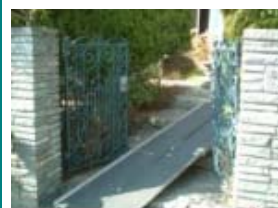
門から玄関までのアプローチの左半分を手摺付スロープにした施工例