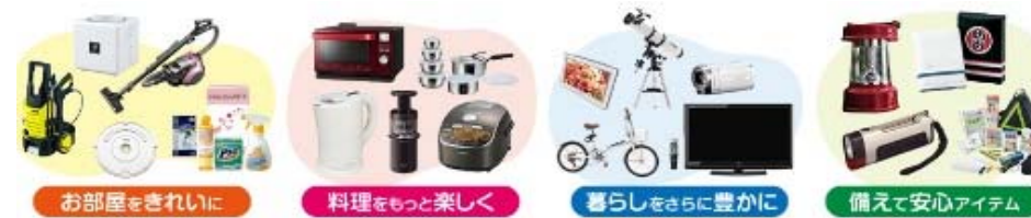
お部屋をきれいに