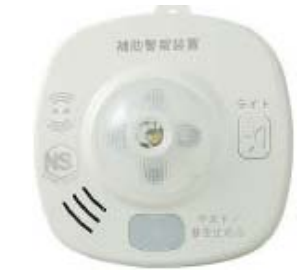
品名: DC05無線LEDフラッシュ