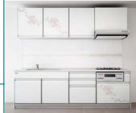
～ ステンドフラワー

ホーローシステムキッチン<レミュー>の扉にオシャレな アートデザイン 2種が加わりました。